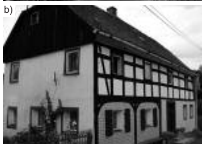
Fot. 4. Piętrowy dom przysłupowy typu wiejskiego – Grabiszyce Górne nr 27, widok: a) z 1999 r.; b) z 2010 r. Photo 4. A typical upper Lusatian two-storey rural house in Grabiszyce Górne nr 27, view: a) from 1999; b) from 2010

ścian piętra, następnie w odsłoniętej konstrukcji szkieletowej zamurowano okna. Została także zamurowana ściana parteru. Z dawnego obiektu pozostała jedynie bryła ogołocona z ozdobnego detalu, symetrii elementów szczytu i konstrukcji drewnianej. Unikatowa dekoracja elewacji została bezpowrotnie zniszczona, gdyż zabrakło nadzoru budowlanego i konserwatorskiego, a przede wszystkim wiedzy o remontach konstrukcji przysłupowych (fotografia 5).