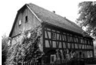
Fot. 6. Piętrowy dom przysłupowy typu wiejskiego – Opolno-Zdrój, ul. Kasztanowa nr 1; widok z 2010 r. Photo 6. A typical upper Lusatian two-storey rural house in Opolno-Zdrój, Kasztanowa street 27, view from 2010

Przypadek 4. Piętrowy dom przysłupowy typu wiejskiego – Opolno-Zdrój, ul. Kasztanowa nr 1. Budynek pozostał w niezmięnionej formie. Widoczny jest oryginalny rysunek konstrukcji szkieletowej i przysłupowej. Jedyne na ścianie szczytowej pojawiły się pnącza zasłaniające konstrukcję (fotografia 6). W tym obiekcie nie są widoczne żadne działania remontowe. Budynek jest dobrze zachowany, ale ze względu na wiek wymaga remontu i z pewnością unowocześnienia infrastruktury.