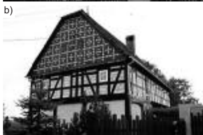
Fot. 5. Piętrowy dom przysłupowy typu wiejskiego – Radzimów nr 10, widok: a) z 1999 r.; b) z 2010 r. Photo 5. A typical upper Lusatian two-storey rural house in Radzimów nr 10, view: a) from 1999; b) from 2010

Przypadek 4. Piętrowy dom przysłupowy typu wiejskiego – Opolno-Zdrój, ul. Kasztanowa nr 1. Budynek pozostał w niezmięnionej formie. Widoczny jest oryginalny rysunek konstrukcji szkieletowej i przysłupowej. Jedyne na ścianie szczytowej pojawiły się pnącza zasłaniające konstrukcję (fotografia 6). W tym obiekcie nie są widoczne żadne działania remontowe. Budynek jest dobrze zachowany, ale ze względu na wiek wymaga remontu i z pewnością unowocześnienia infrastruktury.