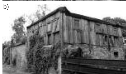
Fot. 7. Piętrowy dom przysłupowy typu wiejskiego – Wyszków nr 14, widok: a) z 1999 r.; b) z 2010 r. Photo 7. A typical upper Lusatian two-storey rural house in Wyszków nr 14, view: a) from 1999; b) from 2010

Przedstawione przykłady pokazują, że konieczne jest prowadzenie remontów zgodnie ze sztuką wznoszenia tego typu obiektów, z zastosowaniem właściwych materiałów budowlanych, objęcie wartościowych obiektów przysłupowych ochroną konserwatorską, prowadzenie remontów pod nadzorem służb budowlanych i konserwatorskich, uświadomienie właścicielom wartości historycznej i artystycznej tego typu obiektów oraz uczenie właścicieli mieszkań w tego typu domach i dbania o nie zgodnie z tradycją.