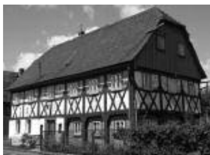
Fot. 2. Dom miejski w Bogatyni Photo 2. Town house in Bogatynia

Dachy domów przysłupowych były dwuspadowe, niekiedy z naczółkami lub mansardowe. Na poddaszach często suszone były farbowane włókna lub surowce wykorzystywane do dalszej przeróbki, stąd pojawiające się w połaciach doświetlające okna typu „wole oko” lub charakterystyczne, wąskie, długie świetliki biegnące wzdłuż połaci dachu, z niemieckiego zwane „oknami szczupakowymi” (niem. Hechtfenster) [4]. Domy miejskie natomiast nie miały murewanej części gospodarczej. Zamiast niej występowała druga drewniana izba tkacka. W bogatszych domach, tzw. faktorów tkackich, w jednej izbie warsztatowej mieściło się nawet do trzech warsztatów tkackich. W tym wypadku zastosowanie niezależnego stropu i odrębnej konstrukcji budynku miało praktyczne uzasadnienie.