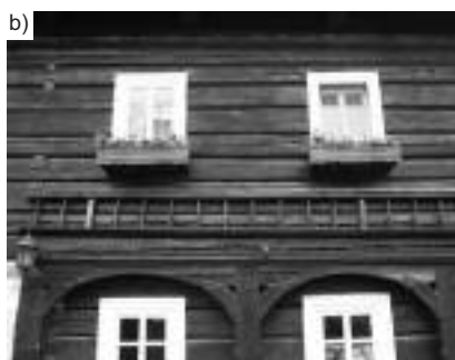
Fot. 1. Dom przysłupowy we wsi Waltersdorf w Czechach (a) z ścianą wieńcową na piętrze podpartą słupami (b) (czes. Podstavkový Dum): [Fot. E. Trocka-Leszczyńska] Photo 1. Upper Lusatian house in Czech Republic (a) with timber walls on the first floor supported by wooden pillar (b) (Czech.: Podstavkový Dum) – in the village of Waltersdorf

nia, przesklepione kolebką lub sklepieniem żaglastym, a ściany piętra i szczyty domów oszalowane deskami lub łupkiem, który układano w różnokolorowe wzory, najczęściej geometryczne (fotografia 2) [3].