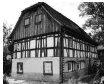
Fot. 3. Piętrowy dom przysłupowy typu miejskiego – Bogatynia, ul. Kościuszki nr 118; widok z 2010 r. Photo 3. A typical upper Lusatian two-storey townhouse in Bogatynia, Kościuszki street 27, view: side photograph from 2010

Przypadek 1. Piętrowy dom przysłupowy typu miejskiego – Bogatynia, ul. Kościuszki nr 118 (fotografia 3) Obiekt ten uległ wielu transformacjom – zwłaszcza ściany parteru, które uzyskały obcy budynkom przysłupowym detal architektoniczny. Ściana szczytowa w parterze, o konstrukcji przysłupowej, a także jedno z okien zostały zamurowane, co spowodowało zaburzenie symetrii obowiązującej w tradycyjnych rozwiązaniach. W ścianie kalenicowej dokonano również drastycznych zmian, gdyż drewniane słupy konstrukcji przysłupowej zostały podcięte do połowy wysokości, pomalowane w „ozdobne” paski i zastąpione