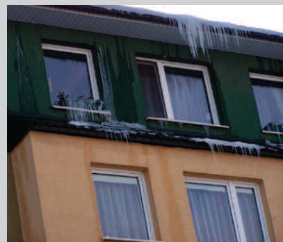
Fot. 2. Styczeń 2010 r. Budynek wielokondygnacyjny, wielorodzinny z dachem pokrytym blachodachówką niewentylowaną (zatkany wlot). Cała elewacja od wschodniej strony budynku pokryta jest wieloma nawisami charakterystycznymi w przypadku przewiewów

uszczelnienia przegród nadal one działają. Zmniejszyła się tylko ilość skroplonej i zamrożonej pary wodnej, przenoszonej przez powietrze poruszane dużą różnicą temperatury. Następne zimy były mniej ostre, a nawet łagodne i dlatego te same szczeliny nie powodowały tak spektakularnych efektów wizualnych, jak na pokazanych fotografiach 1 i 2. W związku z tym można wnioskować, że niekontrolowane przewiewy wyprowadzają z budynków pewną ilość wilgoci technologicznej, ratując częściowo dachy przed przyspieszonym zawilgoceniem i degradacją. Nie oznacza to jednak pełnego zastąpienia wentylacji dachów, która stale usuwa wilgoć z przegrody i stabilizuje w niej zawilgocenie na bezpiecznym, niskim poziomie. Ciąg termiczny – naturalne zjawisko wykorzystywane do wentylowania dachów nie powoduje strat energii, jakie towarzyszą funkcjonowaniu przewiewów. Wentylacja odbywa się głównie dzięki ogrzaniu powietrza wchodzącego do szczelin wentylacyjnych przez promieniowanie słoneczne, a przewiewy powstają dzięki różnicy temperatury między powietrzem wewnętrznym a atmosferą. Warto dodać, że istnieje oczywisty związek: im więcej szczelin i mniejsza szczelność powietrzna bu-