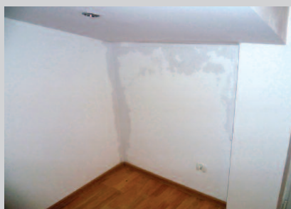
Fot. 3. Luty 2010 r. Budynek jednorodzinny zasiedlony w listopadzie 2009 r. Odkrywką w miejscu zacieku ujawniła bardzo nieszczelne ułożenie paroizolacji i szczeliny nad murlatą prowadzące na zewnętrzną stronę przegrody

Mechanizm powstawania zawilgoceń po wewnętrznej stronie przewiewnej przegrody pokazuje rysunek. Na tym modelu widać dodatkowo negatywną rolę mostków termicznych, które przyspie-