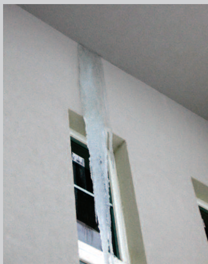
Fot. 1. Styczeń 2010 r. Nawis lodowy powstał w ok. 60 h wskutek działania urządzeń osuszających nieocieplone jeszcze poddasze. Widoczne okno doświetla klatkę schodową, a nad nim jest ocieplony gzyms betonowy

Skutki te są najczęściej widoczne w czasie długotrwałych i silnych mrozów. Powstają wówczas charakterystyczne nawisy lodowe. Najwięcej takich sopli oglądałem zimą 2010 r. (fotografie 1 i 2). We wszystkich budynkach z takimi nawisami lodowymi, dachy i ich pokrycia nie były wentylowane. Jednocześnie w tych budynkach, w następnych latach (po 2010 r.), w okresach zimowych nie pojawiły się już żadne nawisy lodowe ani zacieki w miejscach pokazanych na fotografiach. Nie oznacza to, że nie działają już tam przewiewy. Z charakteru tych zjawisk wynika, że skoro raz pojawiły się dowody funkcjonowania przewiewów, to bez