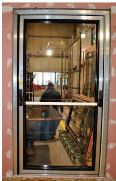
Pressurized surface prior to the smoke control test

Given the exploratory nature of the tests and the fact that all smoke control tests were performed on a single specimen (which is typical for durability tests at this scale), no replicate measurements were performed for the same state of wear. That is why typical statistical measures, such as standard deviation or confidence intervals, were determined. The results should be interpreted qualitatively and quantitatively as change trends for the analysed structure. The conclusions drawn provide a basis for planning more extensive tests with a representative statistical sample.