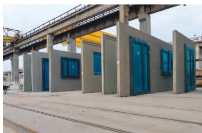
Fot. 2. Proces montażu stolarki okiennej w zakładach prefabrykacji

Analiza kosztów wykazuje, że w budownictwie mieszkaniowym najbardziej czasochłonnym i kosztownym etapem jest wykończenie węzłów sanitarnych. W związku z tym firma GOLDBECK Comfort na początku 2020 r. wprowadziła do sprzedaży łazienki prefabrykowane z pełnym wykończeniem wnętrza (fotografia 3).