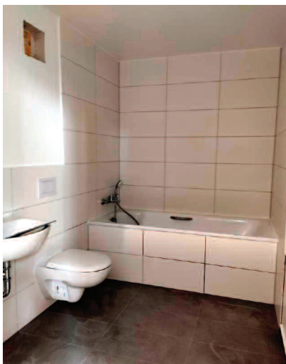
Fot. 3. Wykończona prefabrykowana łazienka GOLDBECK Comfort