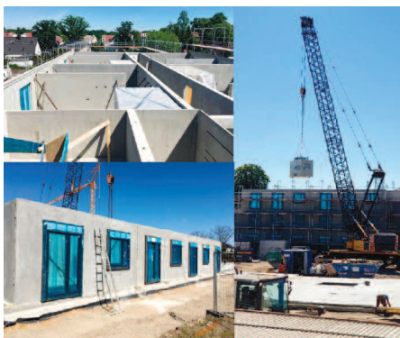
Fot. 1. Budowa budynków mieszkalnych z prefabrykatów modułowych w Berlinie

Odpowiadając na te zmiany i potrzeby rynku europejskiego, wiele zakładów prefabrykacji betonowej opracowuje nowe rozwiązania systemowe do budownictwa mieszkaniowego, które pozwolą na przyspieszenie realizacji inwestycji (fotografia 1). Ogromną za-