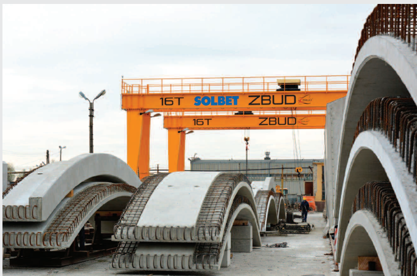
Prefabrykowane elementy lukowe optemARCH

Wyposażyliśmy nasz park maszynowy m.in. w nowe suwnice o udźwigu 16 t