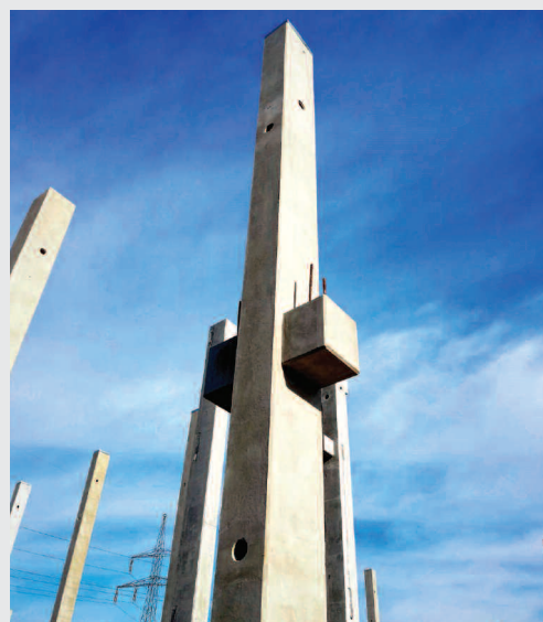
Montaż hali z elementów wyprodukowanych w Zakładzie Betonów w Kolbuszowej

Obecnie intensywnie pracujemy nad tym, aby móc w pełni zaspokoić zapotrzebowanie klientów na nasze wyroby. Motto, które obecnie nam przyświeca, to Buduj z nami od podstaw . Ma ono swoje pełne pokrycie w faktach, gdyż oferujemy materiały budowlane pozwalające na wykonanie obiektu od fundamentów po strop.