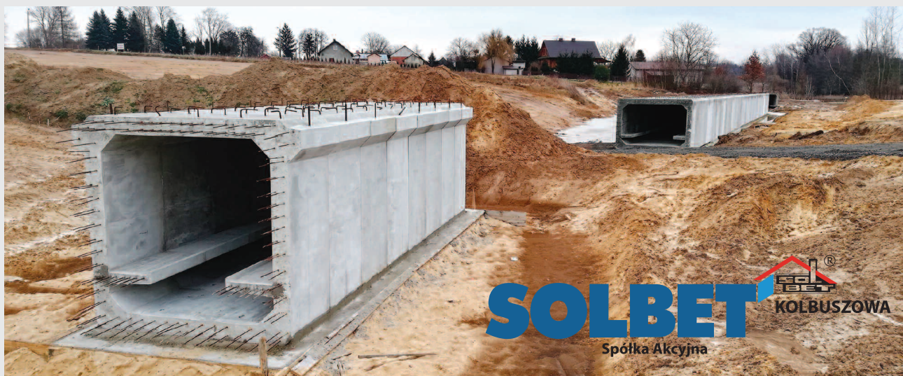
Montaż drogowych przepustów skrzynkowych na budowie drogi ekspresowej S19