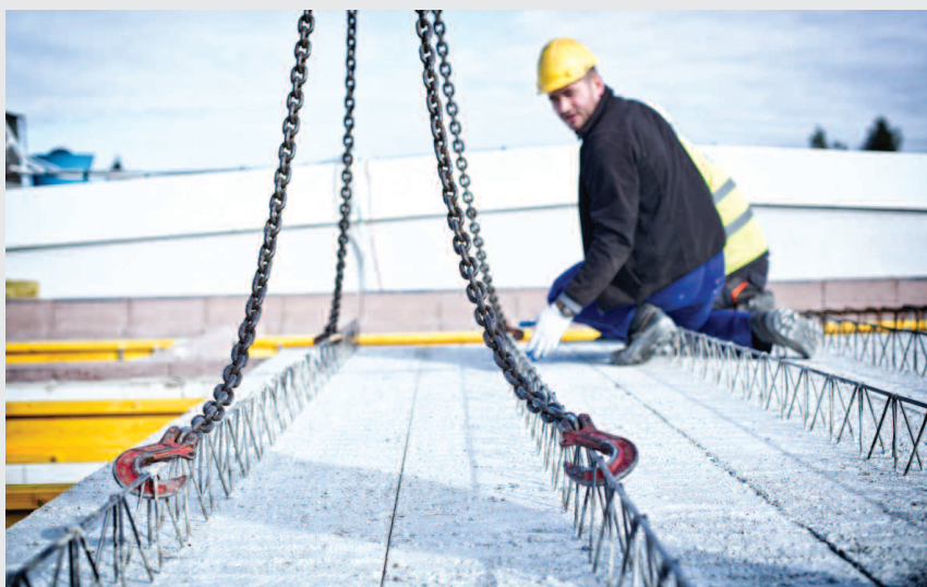
Strop panelowy Vector

oraz gruntownie zmodernizowaliśmy zbrojarnię w Zakładzie Betonów w Kolbuszowej. Na przestrzeni ostatnich lat wyroby spółki SOLBET KOLBUSZOWA zdobyły wiele nagród i wyróżnień. Szczególnie cenimy sobie nagrody przyznane przez kapitułę konkursu „Podkarpacka Nagroda Gospodarcza”, która doceniła m.in. nasz wkład w rozwój regionu w ostatnim półwieczu, oraz wyróżnienie Diament Forbesa przyznane przez miesięcznik „Forbes”.