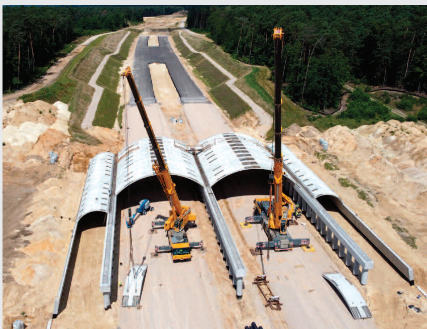
Montaż prefabrykowanych elementów mostowych optemARCH w ciągu drogi ekspresowej