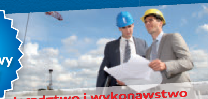
doradztwo i wykonawstwo