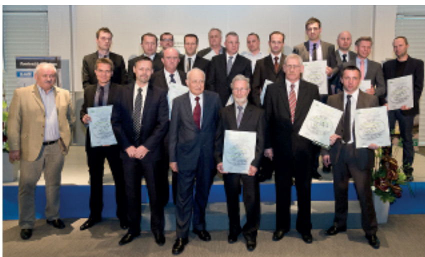
Fot. 2. Elita Dobrego Betonu – Anno Domini 2013