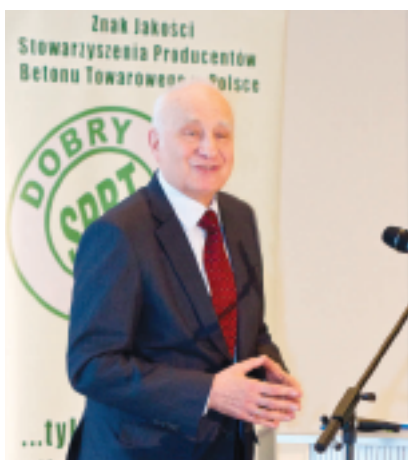
Fot. 1. Prof. Lech Czarnecki – Przewodniczący Kapituły podsumował X edycję Kampanii Znaku Jakości Dobry Beton

X jubileuszowa gala odbyła się w przededniu obowiązywania UE-CPR 305: Construction Product Regulation , które wprowadza nowe wymagania podstawowe dotyczące zrównoważonego budownictwa.