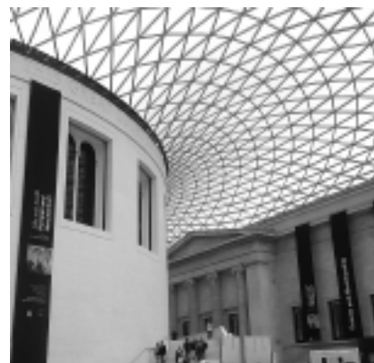
Fot. 4. Zadanie dziedzińca British Museum (proj. Foster and Partners, Buro Happold, 2000)

Projektowanie złożonych artefaktów o swobodnej geometrii zwykle odbywa się na bazie modeli parametryczno-algorytmicznych, które budowane są za pomocą technik skryptowych, tzn. algorytmów komputerowych napisanych