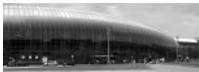
Fot. 1. Dworzec szybkiej kolei TGV, Strasburg (proj. RFR, 2007)

dworca kolejowego TGV w Strasburgu (fotografia 1).