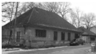
Fot. 1. Widok frontowej elewacji Bet Tahara przed renowacją

Budynek olsztyńskiego Domu Oczyszczeń ma charakter modernistyczny i cechuje się prostą oraz oszczędną formą (fotografia 1), co jest o tyle niezwykle,