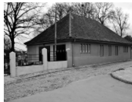
Fot. 3. Zespół budynków Bet Tahara po renowacji

W wyniku wzorowo przeprowadzonej, wg opinii konserwatorów, renowacji i adaptacji Bet Tahara [fotografia 3], miasto pozyskało obiekt użyteczności publicznej o znacznym potencjale społecznym i kulturowym (powierzchnia całkowita 687,0 m 2 , kubatura brutto 1551,0 m 3 ).