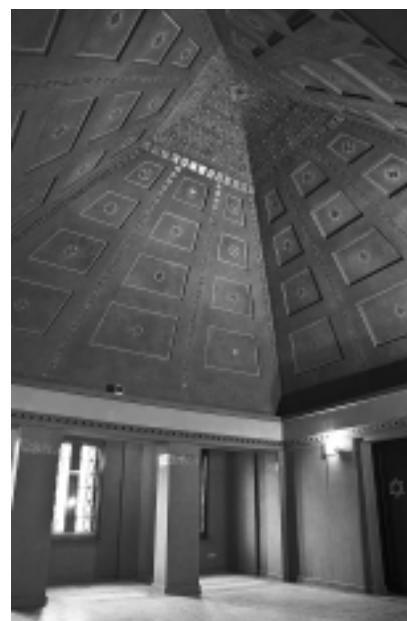
Fot. 2. Sala pożegnań (po renowacji) z ostrosłupowym sklepieniem Photo 2. The farewell room (after the renovation) with the pyramid vault

Pomimo licznych przeróbek we wnętrzach i dość długiego okresu (10 lat), podczas którego obiekt nie był użytkowany, budynki zachowały się w stosunkowo dobrym stanie. Zniszczeniu nie uległy ściany obwodowe, konstrukcja dachu i przede wszystkim najcenniejszy element – ostrosłupowe sklepienie (fotografia 2). We wne-