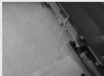
Fot. 3. Do montażu dachówek trzeba stosować specjalne klamry burzowe (spinki), które zabezpieczają przed silnymi podmuchami wiatru