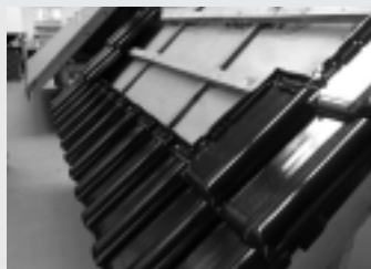
Fot. 2. W następnej kolejności należy ułożyć dachówki boczne, zaczynając od prawej strony dachu oraz pierwszy rząd dachówek przy okapie