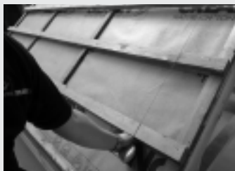
Fot. 1. Prace dekarzkie należy rozpocząć od rozmiarowania łątowania oraz trasowania pionowych linii, wg których zostaną położone dachówki podstawowe oraz boczne na połaci

W przypadku dachu dwuspadowego prace dekarzkie należy rozpocząć od montażu dachówek krawędziowych (z prawej strony dachu) oraz pierwszego rzędu dachówek podstawowych na okapie (fotografia 1). Następnie sznurkiem traserskim rozmierza się pionowe linie, wg których zostaną ułożone dachówki podstawowe na połaci (fotografia 2). Do montażu poszczególnych dachówek należy używać specjalnie dobranych klamer, które zabezpieczają przed silnymi podmuchami wiatru (fotografia 3). W przypadku, gdy pokrycie połaci zostało zamontowane, można pomyśleć o wykorzystaniu dodatków (akcesoriów) dachowych (fotografia 4). Podczas układania pokrycia na dachu dwuspadowym zaleca się stosowanie dachówek krawędziowych – prawej i lewej. Przy szczytach dachu wykorzystuje się dachówkę kalenicową, dzięki której nie trzeba montować na połaci dodatkowo elementów z tworzywa sztucznego przy dolinie fali dachówki. Ponadto dachówka kalenicowa ułatwia prawidłową wentylację, szczególnie przez zastosowanie wraz z nią systemu CREATON „Firstfix”. System ten nie tylko ułatwia bezpieczny montaż dachówki, lecz także sprawia, że nie jest konieczne dodatkowe użycie łąty kalenicowej oraz uszczeliek (do 10 m połaci). Przy zakończeniu gąsiorów warto zadbać o ich wykończenie specjalnie dobranymi zaślepkami.