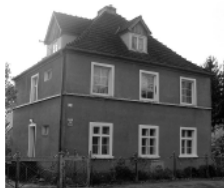
Modernizowany budynek, widok od strony północnej

pu nad pierwszym piętrem mają grubość 44 cm, natomiast powyżej – 33 cm. Ściany zewnętrzne wykonano w dwóch warstwach, a pomiędzy nimi występuje pięciocentymetrowa pustka powietrzna. Nad piwnicą znajduje się strop Kleina, natomiast nad parterem i pierwszym piętrem słupy mają konstrukcję drewnianą. Powierzchnię budynku podano w tabeli 1.